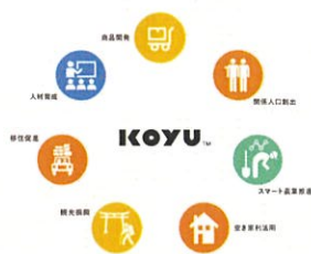
地域商社こゆ財団

大学卒業後にスローウォーターカフェ（有）を起業し、フェアトレード事業に17年間展開。特にサリナス村とのチョコレートづくりは、朝日新聞一面トップに掲載。野生の猿や馬で有名な宮崎県串間市に移住し、「森と海のあいだのトージバ」で、ニホンミツバチの養蜂、与那国馬との暮らし、自給用の畑、フードフォレスト、エコラップ作り、子どもたちと森の木でふね作りなどの環境教育を実践。暮らしと仕事の両面でSDGsを実践している。上智大学とライブビジネススクールで非常勤講師。